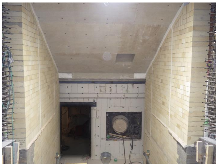
焼却炉耐火物施工中