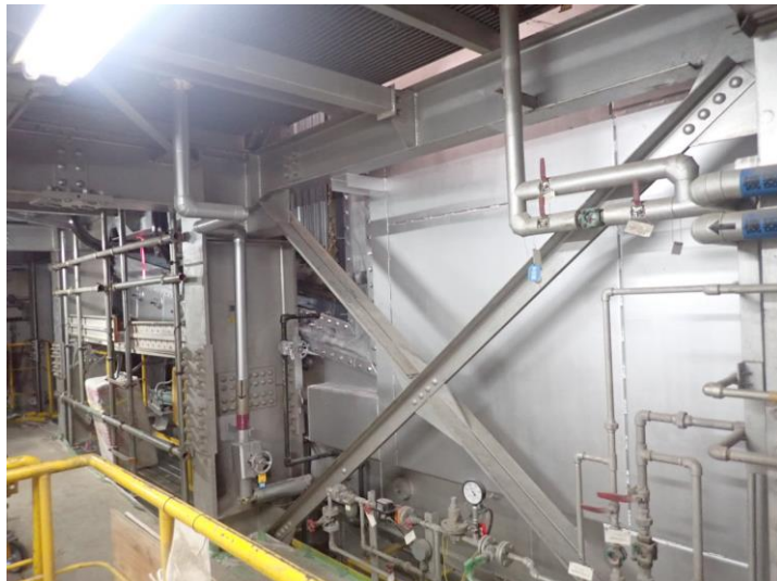
焼却炉ケーシング据付後