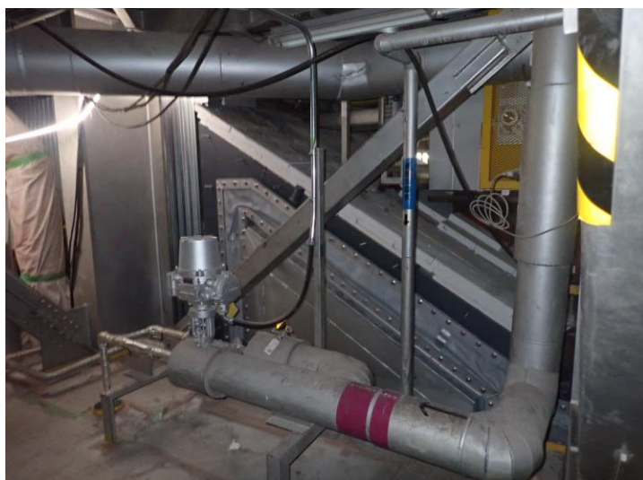
焼却炉ケーシング据付後