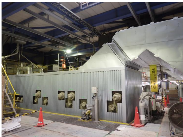
ボイラ保温施工中