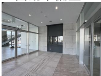
風除室(エントランス)