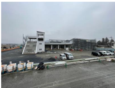
3月末全景写真 (南側から撮影)

工事中は、皆様のご理解とご協力を賜り、改めて無事故・無災害で完工出来た事に厚くお礼 申し上げます。地域住民の安心・安全の確保に重要な役割を果たす、桜川消防署庁舎建設 工事に携われたことに改めて感謝申し上げます。今号で工事かわら版は最終号となります。 3ヶ月に一度ではありましたが、このかわら版を通じて工事の状況がお伝えできたのでは ないかと思っております。ご愛読頂きましてありがとうございました。