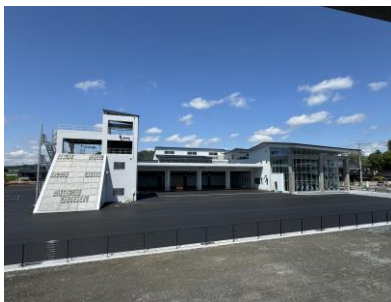
4月末全景写真 (南側から撮影)